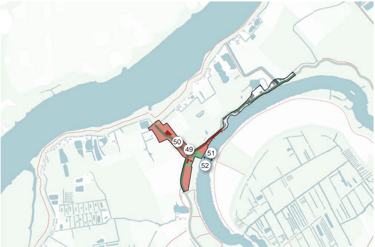
kaart 19 leefbaarheidsplan Weert