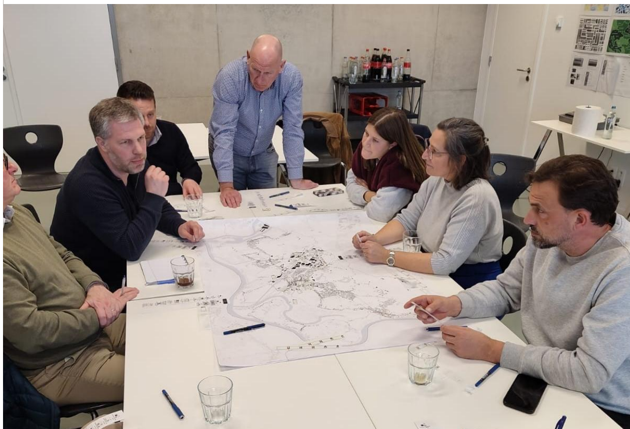
Figuur 2: Cocreatiesessie 1 (4 maart 2026)

Vervolgens wordt het ontwerp van het beleidskader onderworpen aan een openbaar onderzoek van minimaal 90 dagen. Tijdens deze periode kan iedereen het plan inkijken en opmerkingen of bezwaren indienen. De gemeente zal dit openbaar onderzoek actief communiceren, onder meer via haar gebruikelijke communicatiekanalen. Tijdens dit openbaar onderzoek zal de gemeente ook een publiek infomoment organiseren om keuzes en plannen toe te lichten.