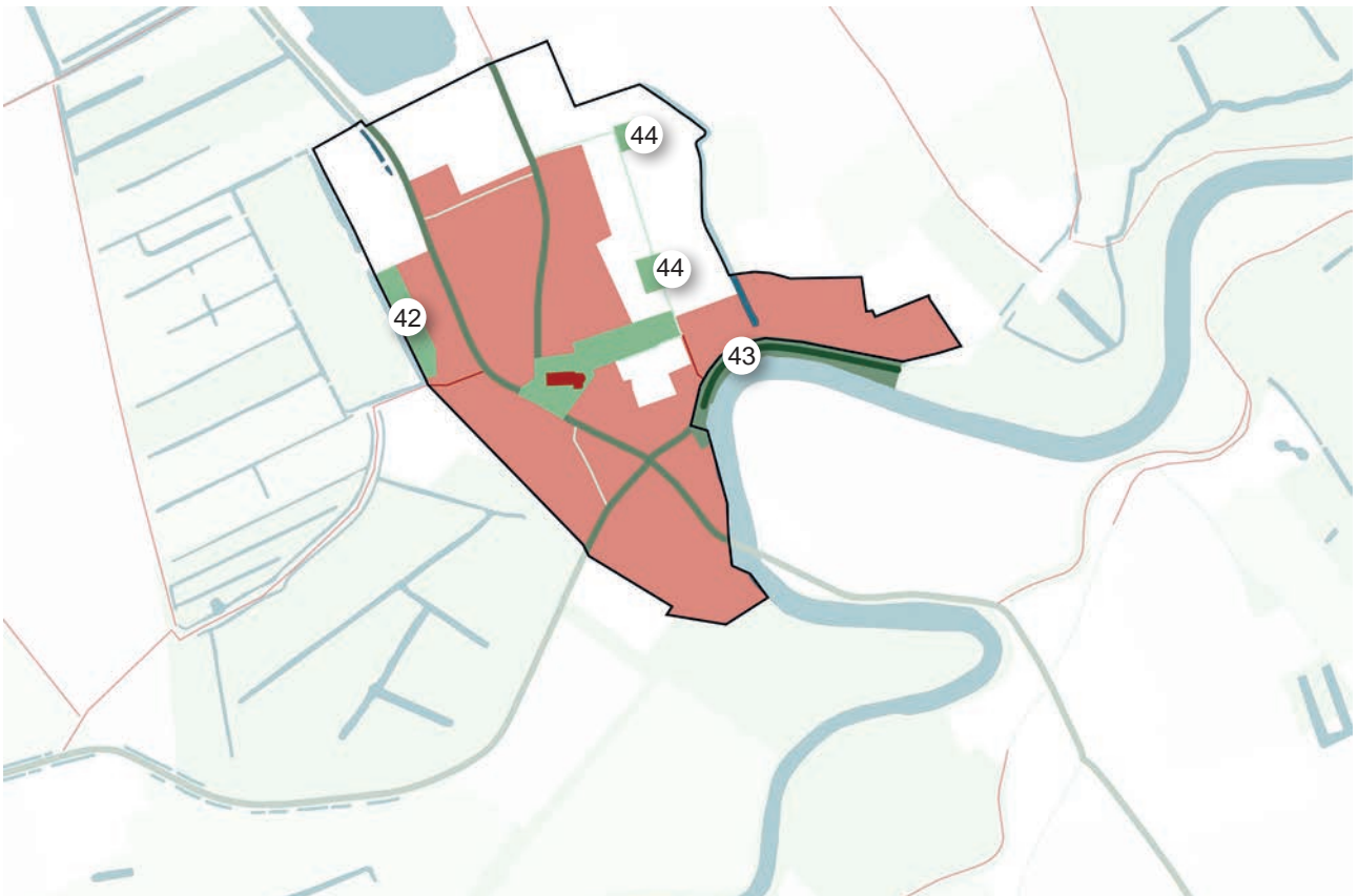
kaart 17 leefbaarheidsplan Eikevliet