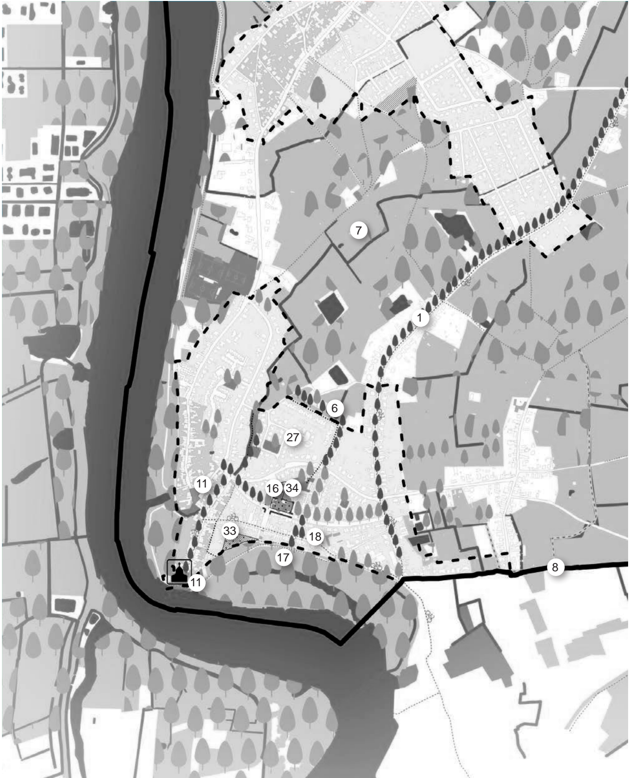
kaart 13 acties Mariekerke